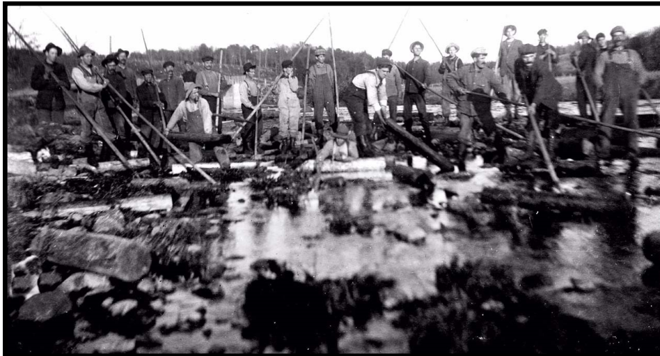
Équipe d'hommes faisant « la drave » sur la rivière Nicolet (branche sud-ouest) au moulin MIQUELON sur le lot 8 entre les rangs V et VI de Wotton (1907)