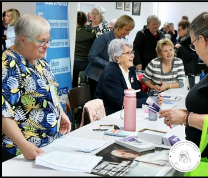
Merci pour cette belle initiative!

Une collation a été offerte grâce à la contribution financière de plusieurs municipalités, la Fromagerie Proulx et Coop Métro. Pour clôturer la journée, les visiteurs ont pu gagner des prix offerts par les exposants.