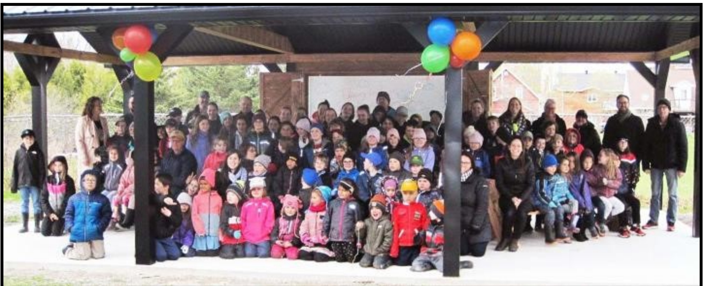
Les élèves, professeurs et dignitaires présents