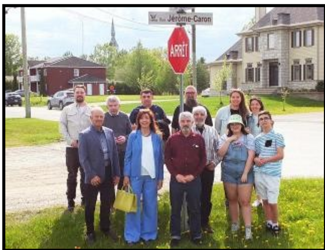
La famille Caron