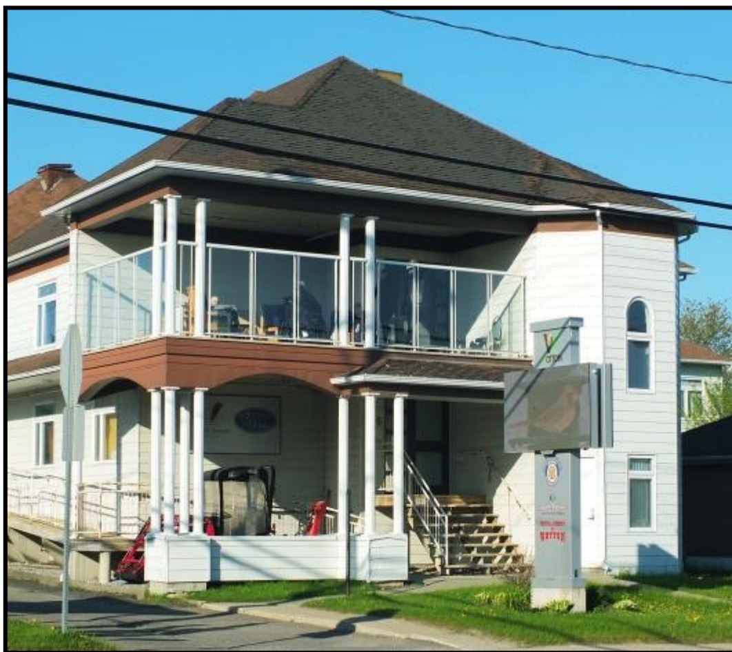
Résidence pour personnes âgées (RPA) de Wotton