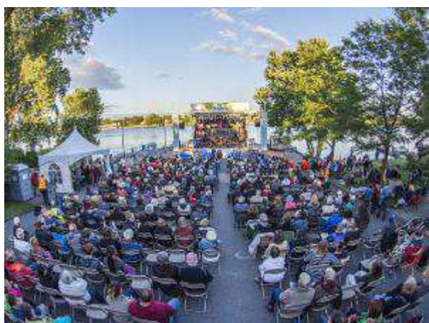
Nouvelle Scène Jean-Paul Guimond – 1 er juillet 2016-Festival Chants de Vielles