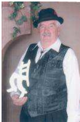
Prix Aldor Morin en 2005