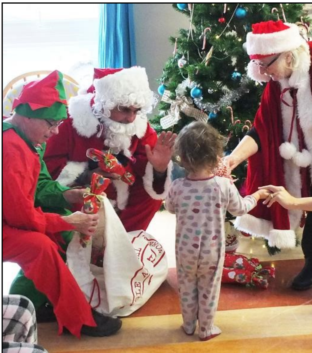
Jako Le Lutin, le Père Noël et la Mère Noël.