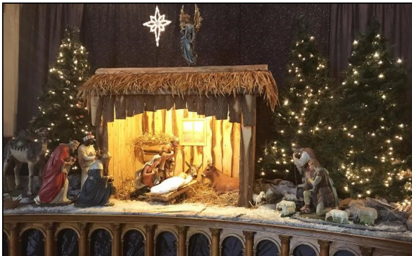
Nouvelle crèche de Wotton