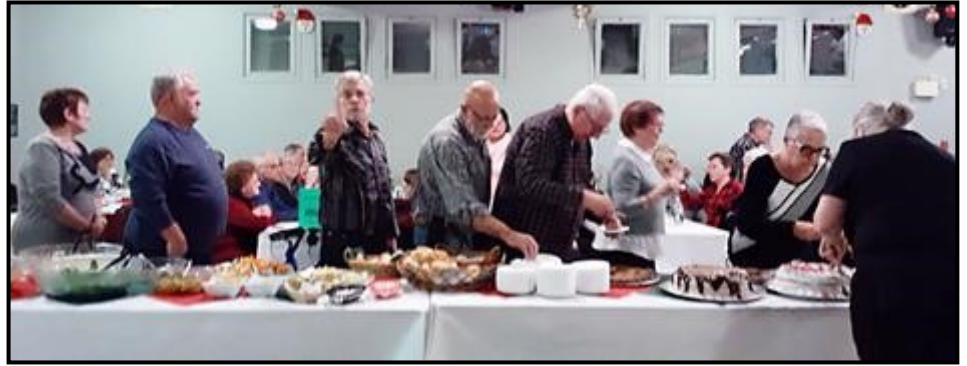
Le souper de la FADOQ

La salle Ti-Maurice a été témoin de deux événements festifs en janvier. Le 13 janvier, la Fadoq avec ses 147 invités a rassemblé des membres et amis de différentes municipalités. Les rires et les cris de joie fusaient de partout dans la salle, tant au souper que durant la soirée dansante.