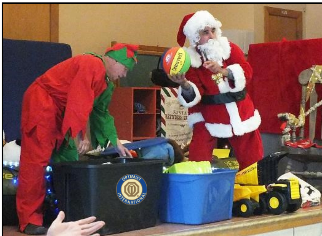
La remise des cadeaux

fabriquer des briques de neige, ce qui est très apprécié des enfants en ce moment car ils aiment construire des forts dans la cour d'école. Cette activité, en plus d'être amusante, favorise le travail d'équipe et l'entraide. Les jeunes doivent établir des plans et s'entendre sur la construction. Ils vont chercher des blocs de neige avec leurs traîneaux et leurs pelles et ils montent des murs. Ils doivent aussi établir des règlements, comme ne pas détruire la construction des autres, demander la permission pour visiter le fort d'un autre groupe et respecter les limites et les zones assignées. Malgré quelques conflits au début, les constructions vont bon train et les enfants sont fiers de leurs réalisations.