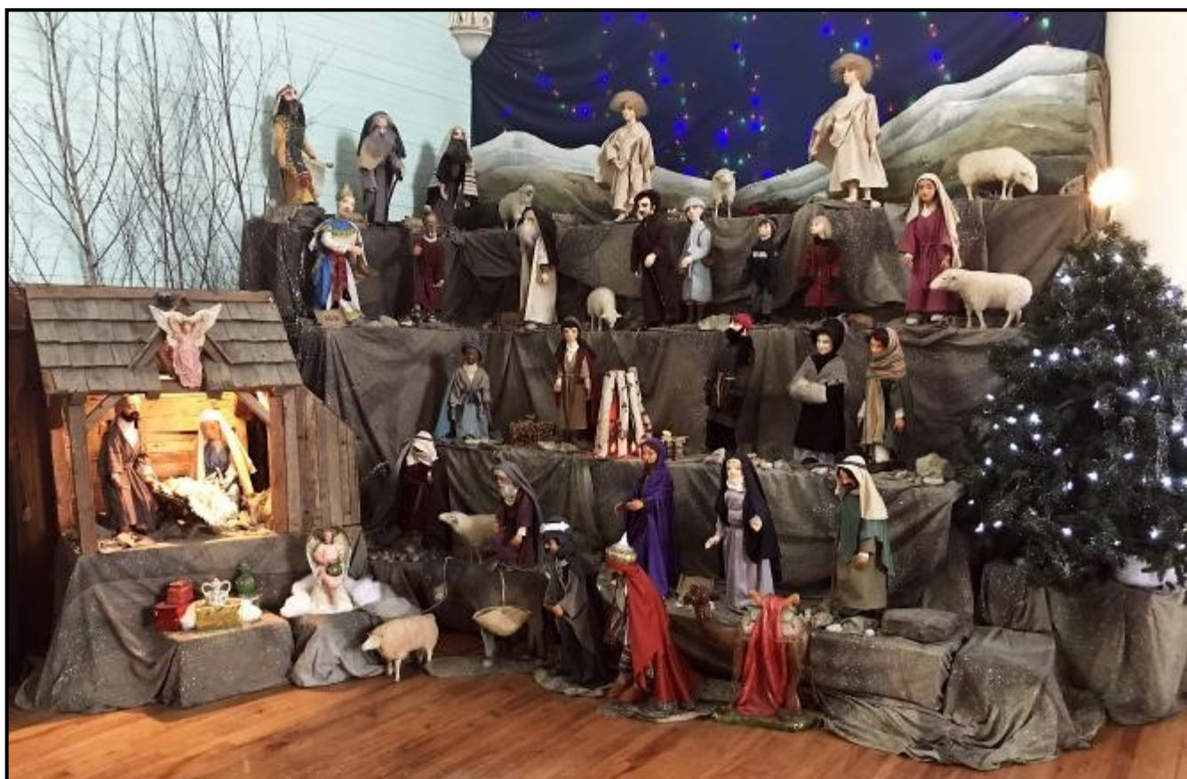
Crèche de St-Adrien