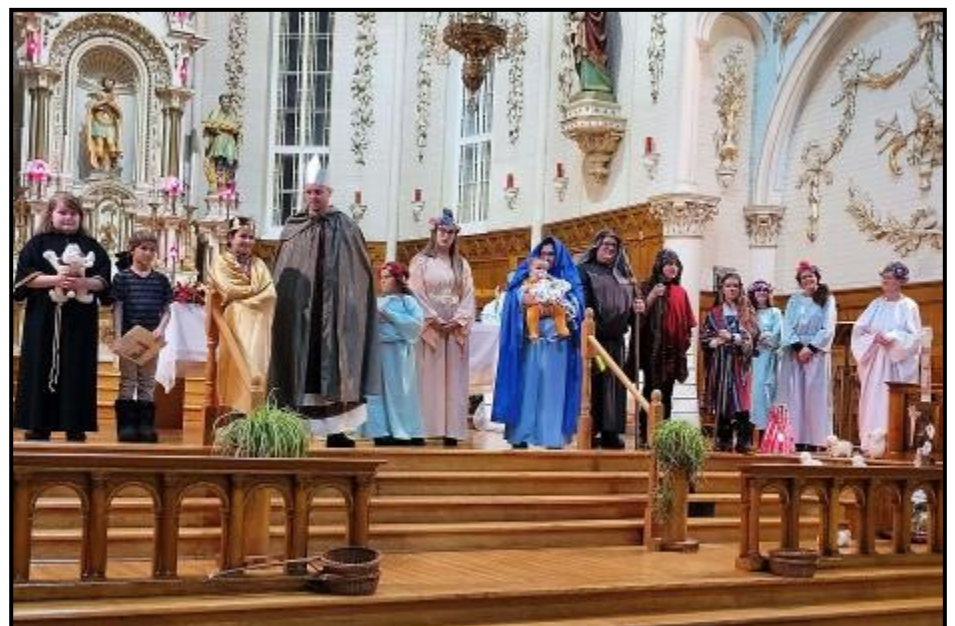
Tous les personnages de la crèche vivante