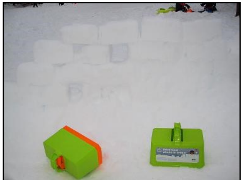
Le fort Par Marie-Josée Gamache