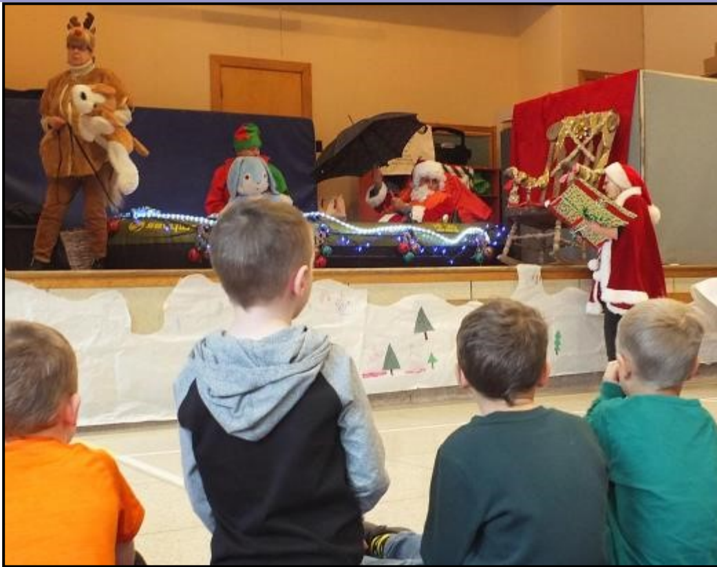
La pièce de théâtre