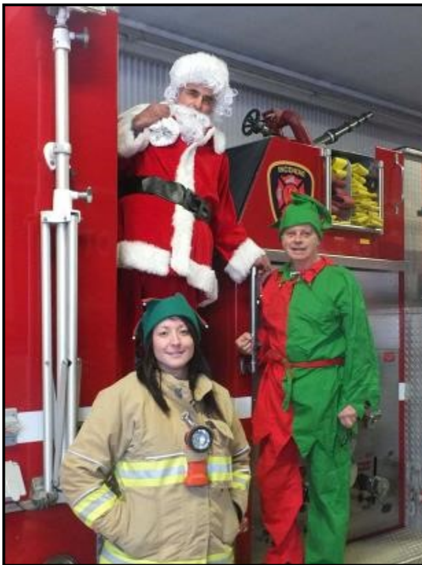
Départ vers le CPE